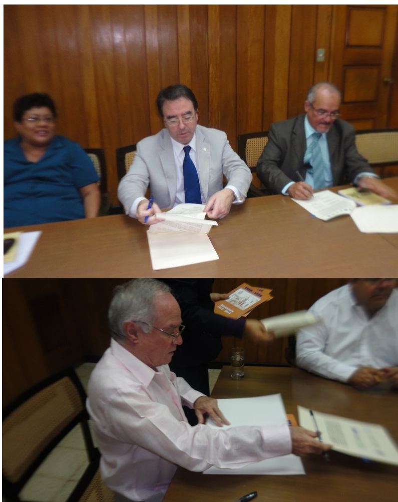
Imagen 3. Firma del convenio por los Rectores.

Finalmente en enero del año 2012 fue creada la Red de Archivos Universitarios de Centroamérica (RAUC) mediante la firma de un convenio específico entre ocho universidades: Universidad de Alcalá (España), Universidad Nacional Autónoma de Nicaragua-León, Universidad Nacional Autónoma de Nicaragua-Managua, Universidad Nacional de Ingeniería (Nicaragua), Universidad Nacional Agraria (Nicaragua), Universidad de Panamá y Universidad Autónoma de Chiriquí (Panamá).