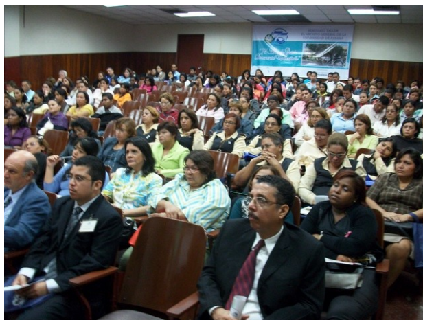
Imagen 1. “75 Años de gestión documental universitaria” Universidad de Panamá 2010.

Desde este momento los responsables de los Archivos de UAH, UNAN-León, y UP comenzaron a trabajar juntos en varias líneas: